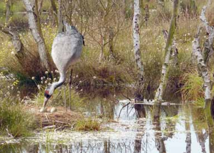
Ein bis zwei Küken pro Kranichpaar schlüpfen im April / Mai und bleiben bis zum nächsten Frühjahr bei den Eltern.